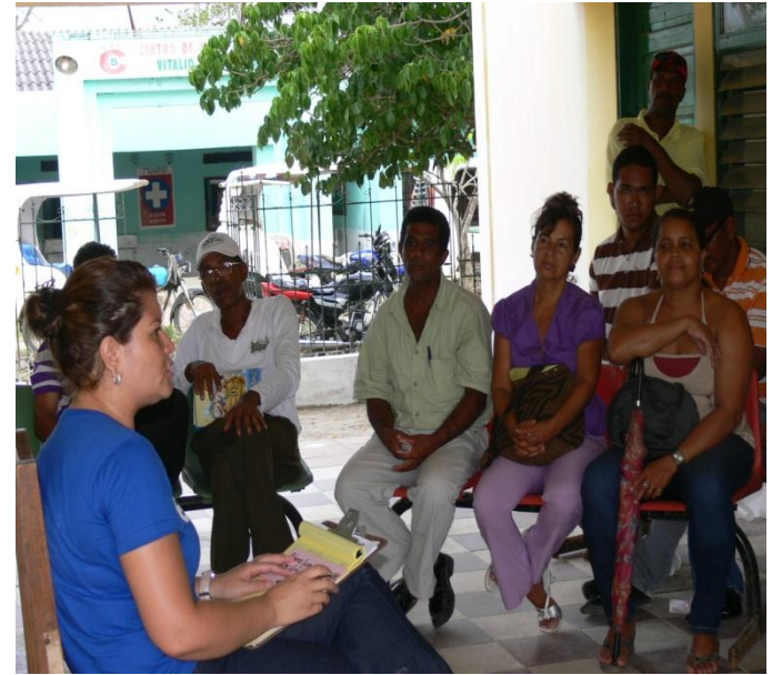
Taller Soplaviento (Bolívar). Julio 18 de 2011