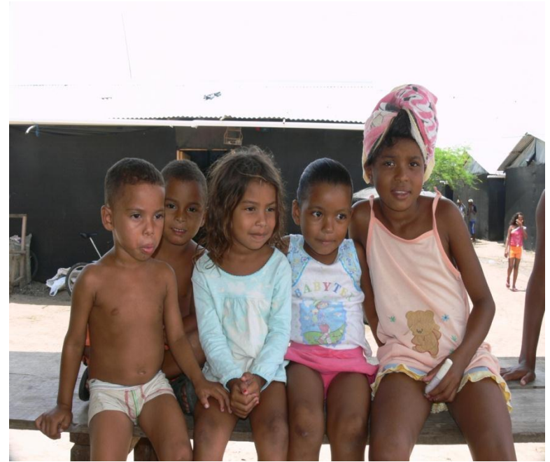
Visita Albergue Candelaria (Atlántico) Julio 20 de 2011