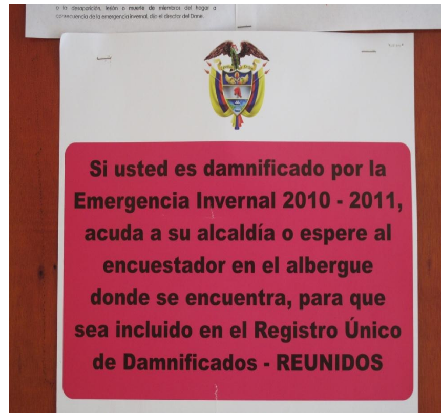
Cartel informativo a damnificados del municipio de San Estanislao (Bolívar) Junio de 2011

Identificación de capacidades, fortalezas, debilidades y oportunidades de los actores institucionales de los municipios del canal del dique, que permitan definir estrategias para fortalecer capacidades locales que generen condiciones para la gestión integral del riesgo en la zona.