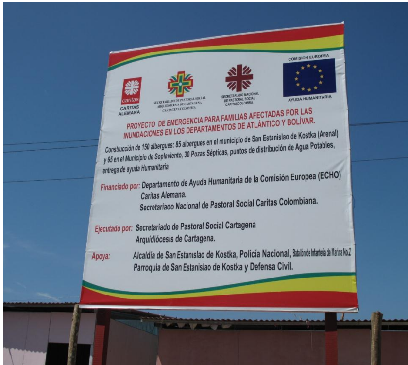
Valla informativa ubicada en el municipio de San Estanislao (Bol) Proyecto construcción albergues Fuente : Avanzada de Campo AP Junio de 2011