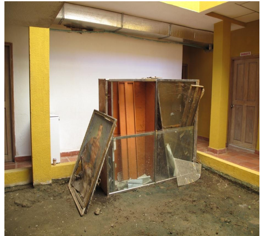
Sede Alcaldía de Santa Lucia (Atl) después de la emergencia invernal. Fuente : Avanzada de Campo AP Junio de 2011