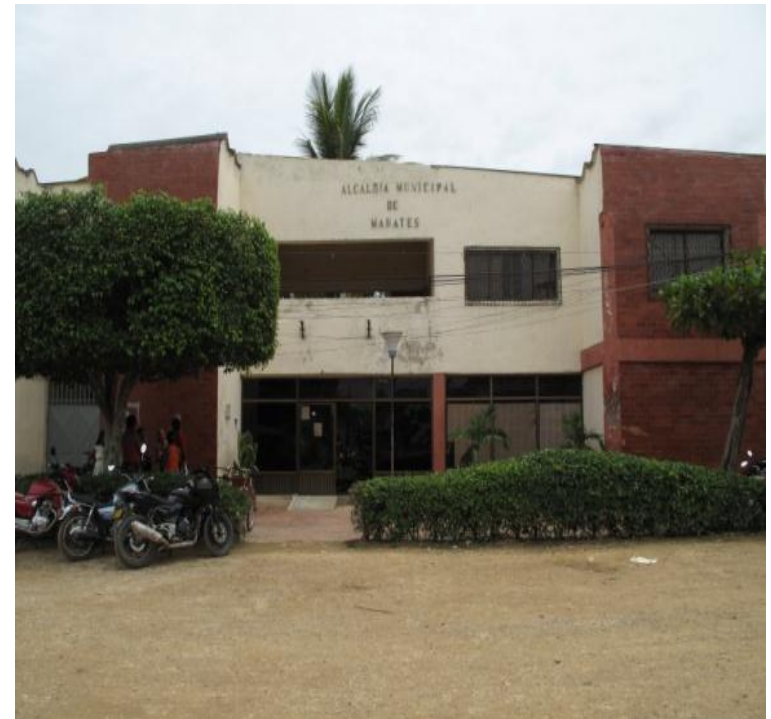
Sede Alcaldía de Mahates (Bolívar) Junio de 2011