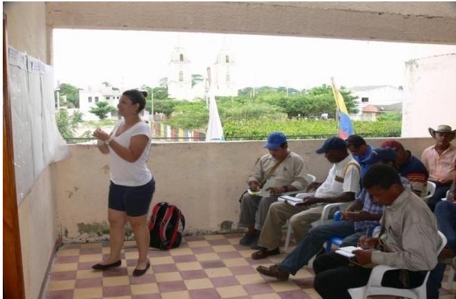
Taller Mahates (Bolívar) Fuente: Oihana Cuesta Gómez, Julio 21 de 2011

Los temas relacionados con el municipio y la administración municipal son múltiples y variados, por lo que una capacitación integral es inmanejable para la Asistencia Preparatoria y para los proyectos que se deriven de la misma, de manera que es necesario centrar capacitación y formación en temas específicos que propicien el fortalecimiento institucional y la gestión integral de riesgos en el marco de la normatividad reciente en materia de ordenamiento territorial, reconstrucción después de la emergencia invernal y asociatividad entre municipios y regiones.