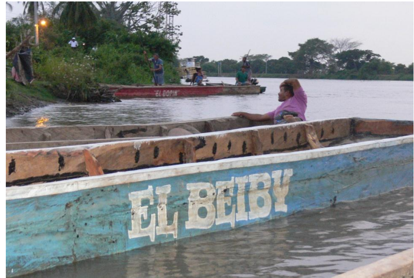
Bonguero de Soplaviento